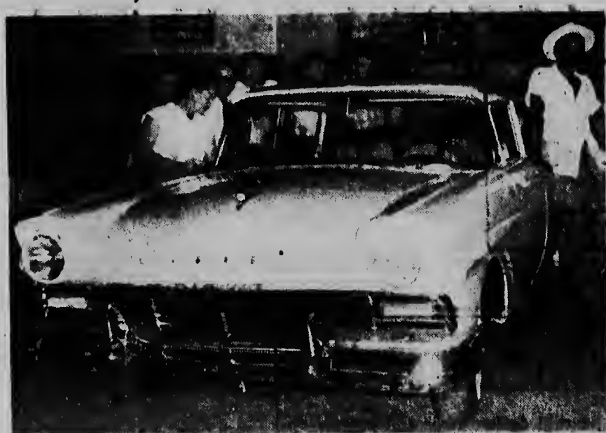
De Ford 1957 heeft getuige deze foto beklifft genoeg. Deze prachtige wagen is nog dagelijks te bezichtigen bij de firma Neme in Oranjestad.